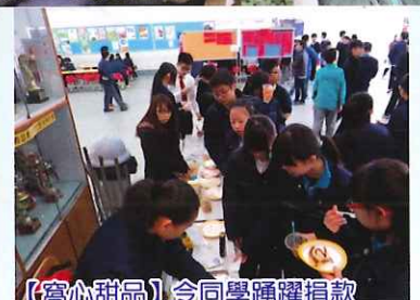
【窩心甜品】令同學踴躍捐款