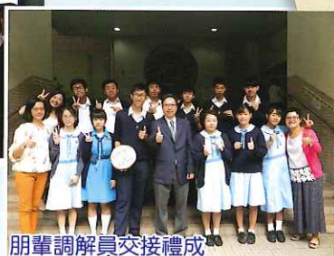
朋輩調解員交接禮成