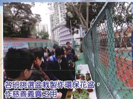
各班挑選盆栽製作環保花盆，作慈善義賣之用

今年《校園慈善週》及《師生同樂日》為香港公益金共籌得港幣 19,205.50。希望明年再創佳績。