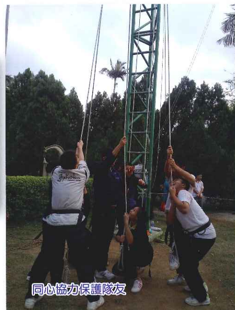
同心協力保護隊友