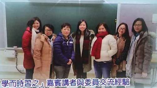
「學而時習之」嘉賓講者與委員交流經驗