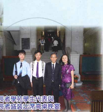
長者學苑學生代表與長者盛裝出席高桌晚宴