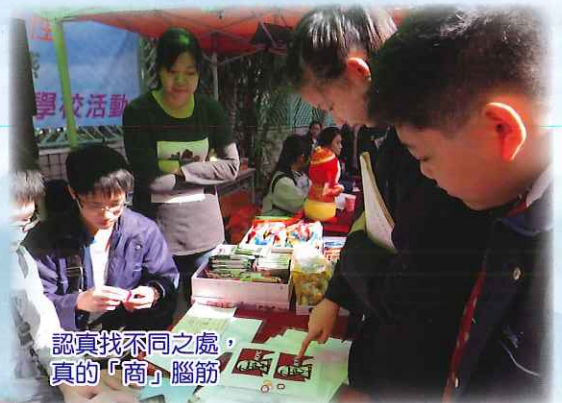
認真找不同之處，真的「商」腦筋