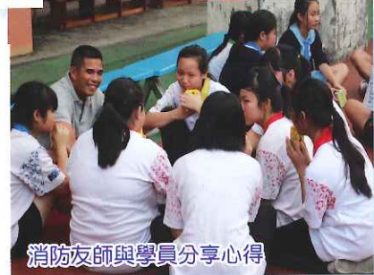
消防友師與學員分享心得