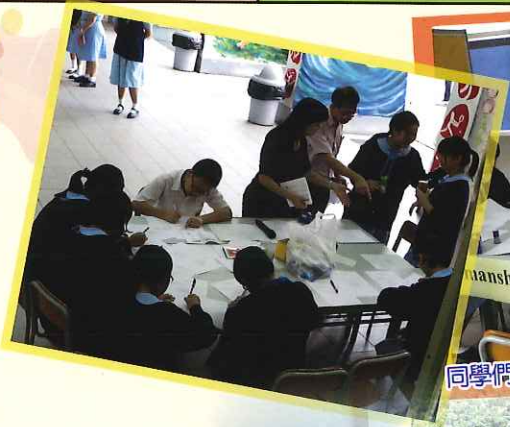
同學們專心參與英文書法比賽