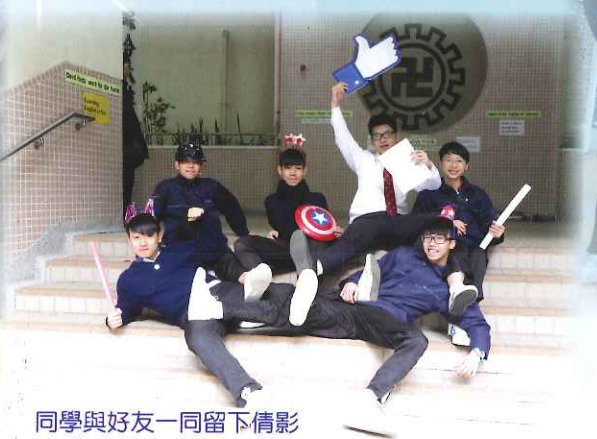
同學與好友一同留下倩影