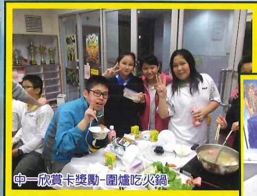
中一欣賞卡獎勵-圍爐吃火鍋