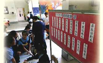
同學積極參與廣東話歇後語猜謎遊戲