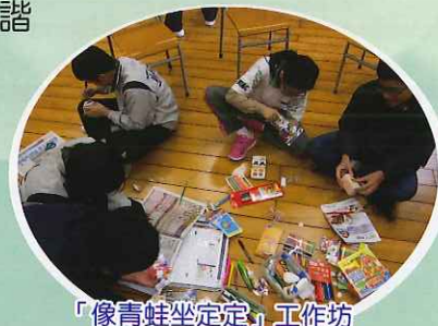
「像青蛙坐定定」工作坊

此外，為鼓勵同學積極參與社會服務，本校與耆康會懷熙葵涌長者地區中心繼續舉辦「佛教葉紀南耆康長者學苑」，開設扭氣球班、長者電腦班及「靈猴獻瑞慶新春」敬老活動，讓學生義工培養關愛護老之心。同時，透過家長座談會促進親子關係，締造和諧的家庭生活。