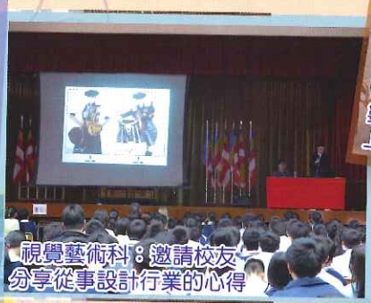
視覺藝術科：邀請校友分享從事設計行業的心得