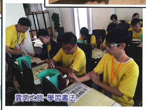
雲南之旅-學習書法