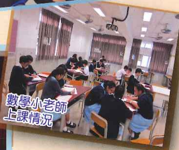
數學小老師上課情況