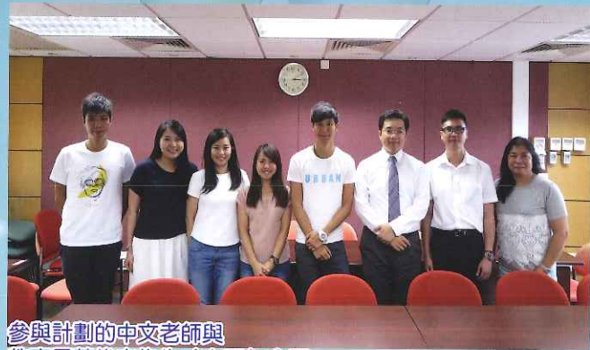
參與計劃的中文老師與教育局黃俊文先生(右三)合照

備課節除討論教學進度外，還增強了老師議課和評課的意識，反思教學過程，以期運用不同的教學法，令學生更易掌握學習的內容。