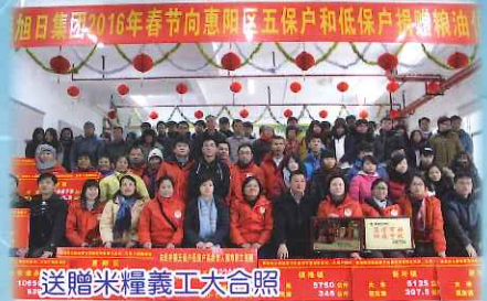
送贈米糧義工大合照