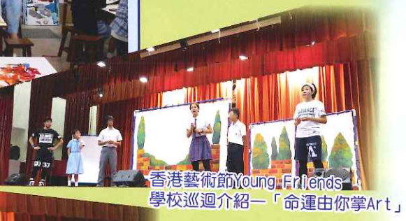
香港藝術節Young Friends 學校巡迴介紹—「命運由你掌Art」