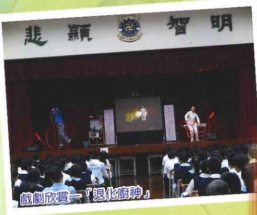
戲劇欣賞—「退化廚神」