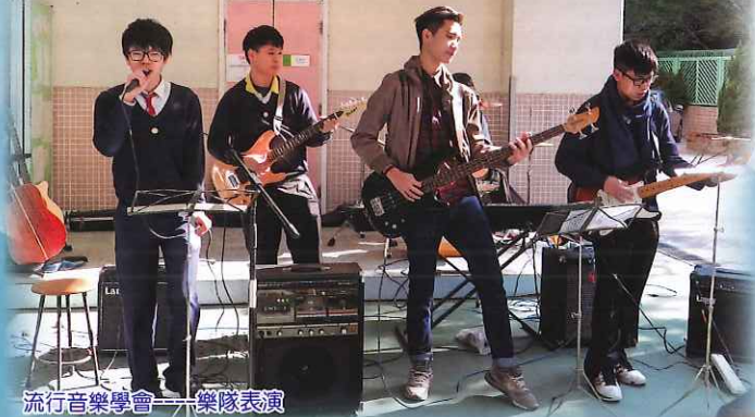
流行音樂學會——樂隊表演