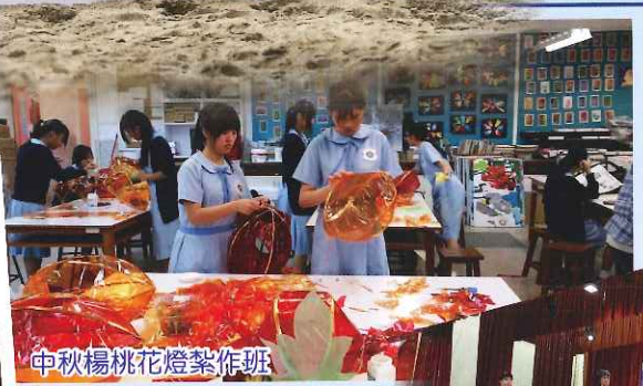
中秋楊桃花燈紮作班