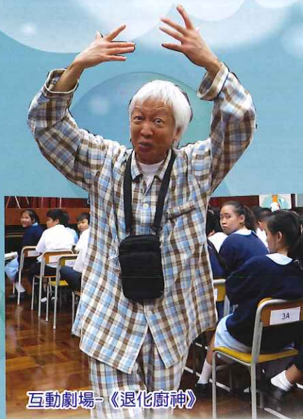
互動劇場-《退化廚神》