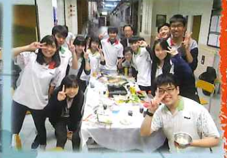
校長與眾大哥哥校園歡聚