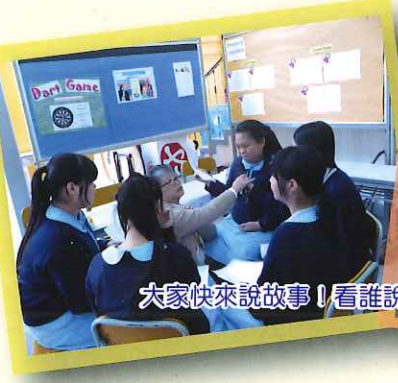
大家快來說故事! 看誰說得最動聽