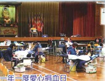
一年一度愛心捐血日