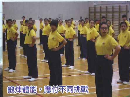
鍛煉體能，應付不同挑戰