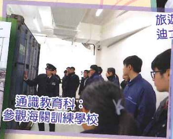
通識教育科：參觀海關訓練學校