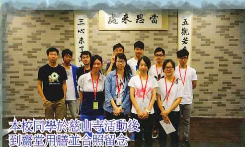
本校同學於慈山寺活動後到齋堂用膳並合照留念

大埔慈山寺已於七月舉辦第二屆青少年夏令營。本校共有十一位高年級同學參加。活動包括寺院定向、宗教體驗、營火晚會、茶禪及向觀音聖像供水等。主辦機構希望透過四日三夜的活動，提高同學對慈山寺及佛教儀軌的認識。