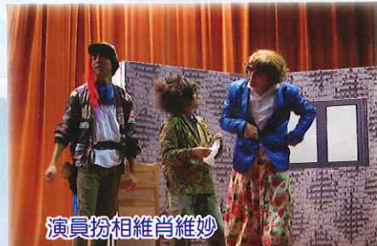
演員扮相維肖維妙