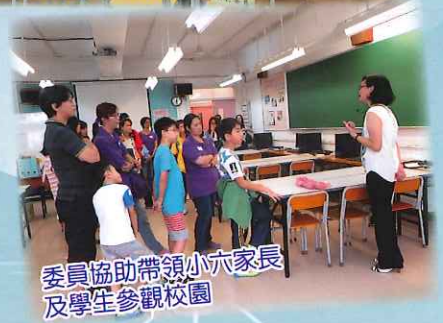
委員協助帶領小六家長及學生參觀校園