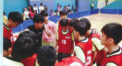
上下一心，隊員仔細聆聽教練臨場指導

本校閃避球隊成立於2011年，以培訓學生團結及堅毅精神為球隊宗旨。我們每年均會參加全港性校際賽事，在老師同學的共同努力下，去年取得了突破性的佳績，男、女子隊雙雙奪冠，成為全港冠軍！