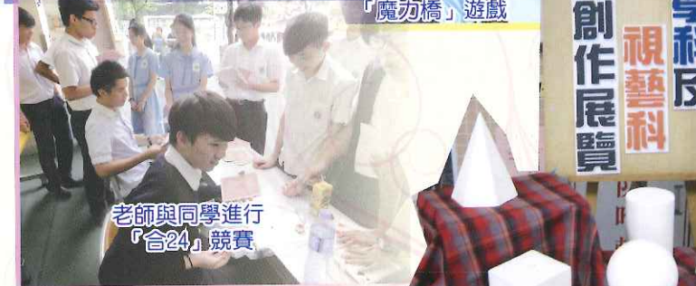
老師與同學進行 「合24」競賽