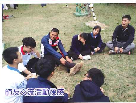
師友交流活動後感