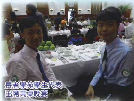
長者學苑學生代表出席高桌晚宴