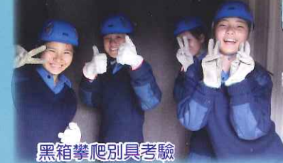
黑箱攀爬別具考驗