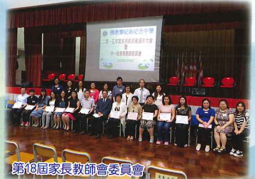
第18屆家長教師會委員會

最後，期望透過家長與學校的緊密合作，舉辦多元化的家校合作活動，並提供意見予學校各持份者，讓學校工作成效更上一層樓。