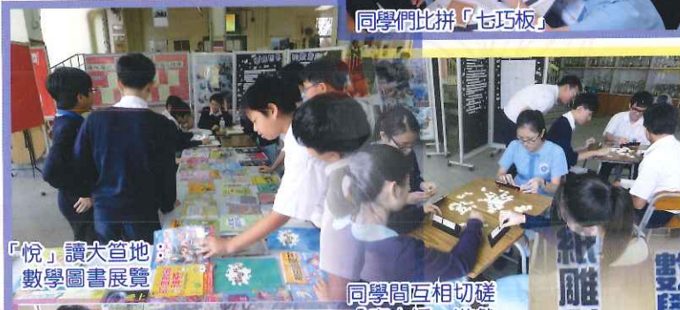
「悅」讀大管地： 數學圖書展覽