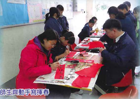
師生齊動手寫揮春