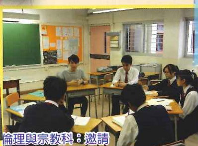
倫理與宗教科：邀請校友分享學習心得