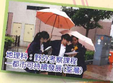
地理科：野外考察課程—都市可持續發展(臺灣)