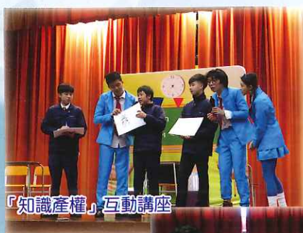
「知識產權」互動講座