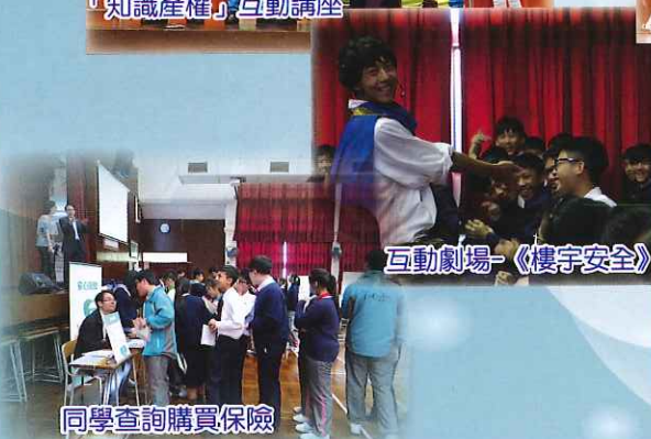
互動劇場-《樓宇安全》