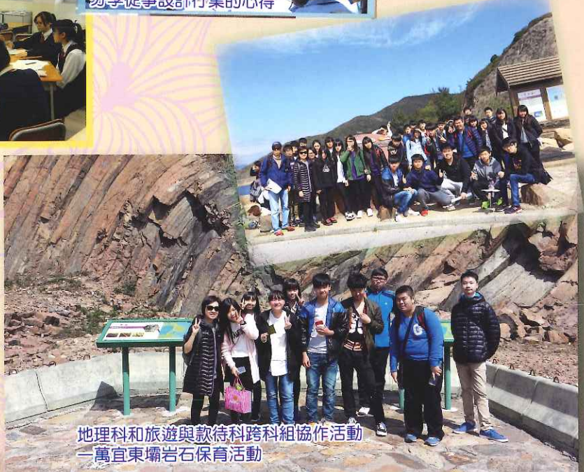
地理科和旅遊與款待科跨科組協作活動—萬宜東壩岩石保育活動