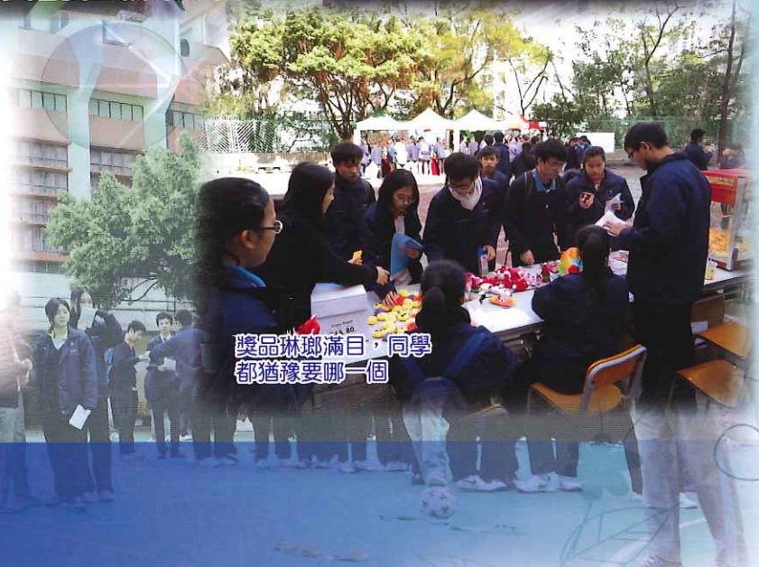
獎品琳瑯滿目，同學都猶豫要哪一個