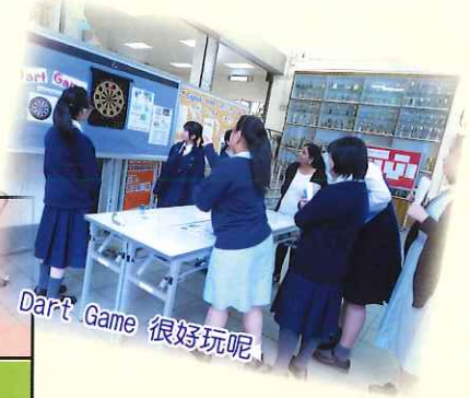
Dart Game 很好玩呢