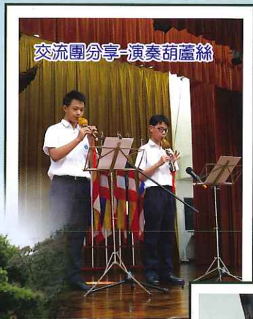
交流團分享-演奏葫蘆絲