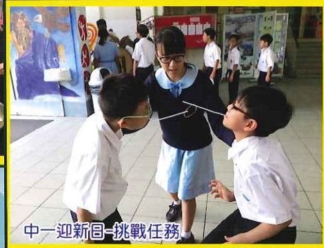
中一迎新日-挑戰任務