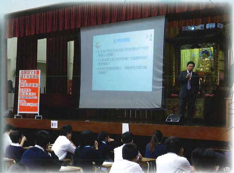
本校中國語文科連續兩年參加教育局校本支援計劃，以提升學與教效能