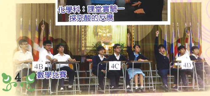
4B 4C 4D 數學比賽