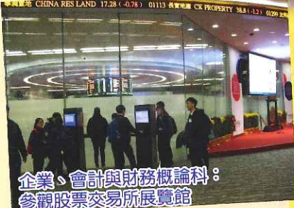
企業、會計與財務概論科：參觀股票交易所展覽館