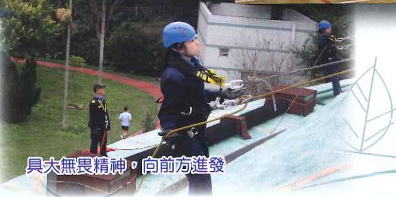
具大無畏精神，向前方進發