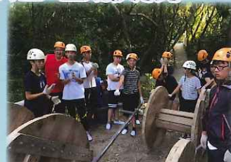
大哥哥群策群力完成任務

本年度的「大哥哥大姐姐計劃」，透過不同的義工活動，訓練學長們成為義工領袖。除了自身得著外，亦希望他們運用不同的義工經驗，協助學弟妹參與其他義工活動。在此特別鳴謝「露宿者行動委員會」，為一眾學長們安排探訪活動，亦為我們安排了一頓晚餐，體驗一下派發給露宿者的晚飯。我們事前亦準備了不少食物包、心意卡及手繩，藉此送上我們對露宿者的關心。