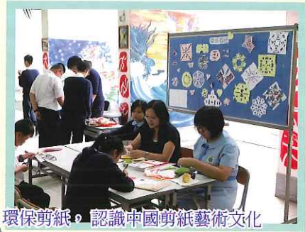
環保剪紙，認識中國剪紙藝術文化