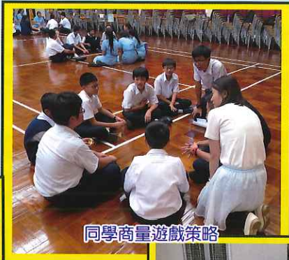
同學商量遊戲策略