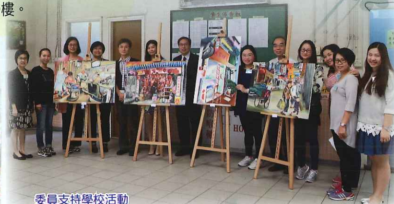
委員支持學校活動