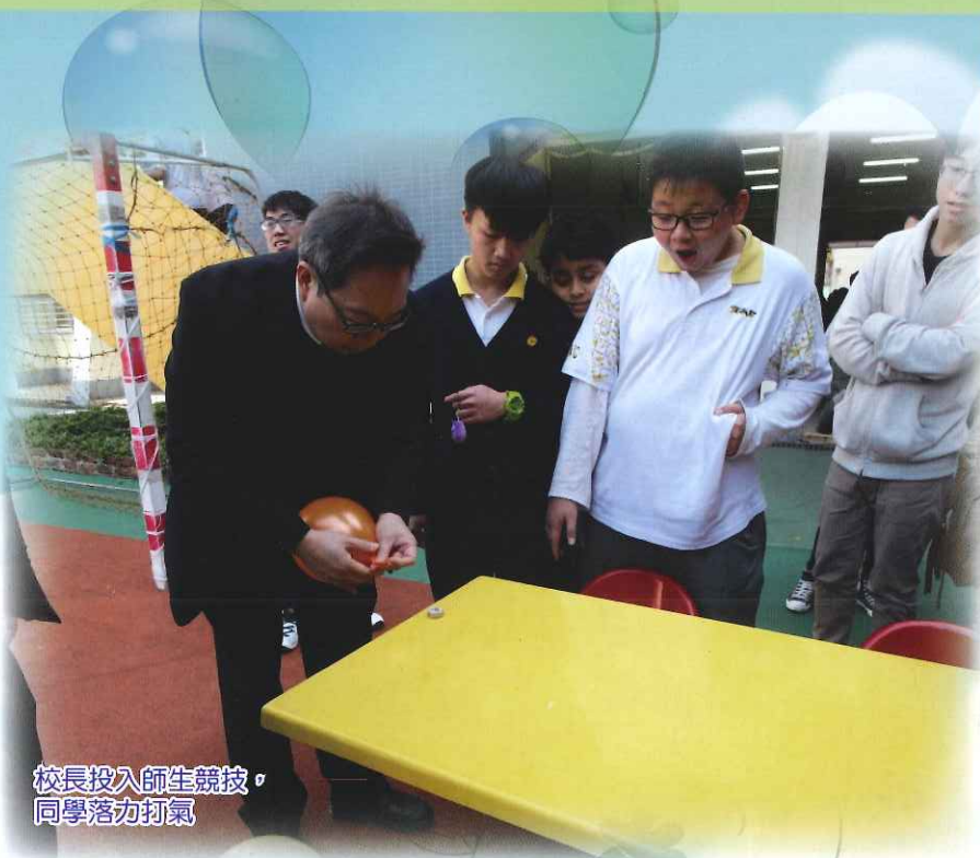
校長投入師生競技， 同學落力打氣