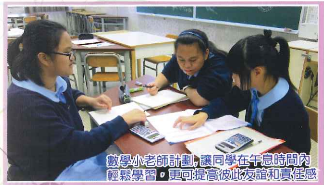
數學小老師計劃，讓同學在午息時間內 輕鬆學習，更可提高彼此友誼和責任感