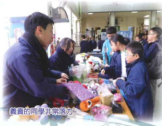
義賣的同學非常落力