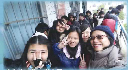
參觀惠陽的一所中學

這次探訪令我明白「幸福不是必然的」。探訪家庭時，我看到他們的居住環境非常簡陋，我明白到「施比受更有福」道理。幫助別人之外，也令自己獲得那麼多寶貴的經驗，我們應當感恩，感恩父母讓我們生活美滿，能住在這個生活條件美好的城市中。