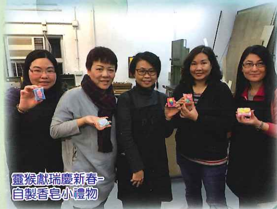
靈猴獻瑞慶新春-自製香皂小禮物