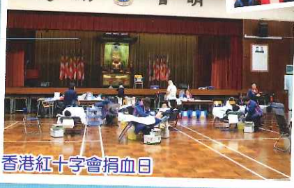
香港紅十字會捐血日