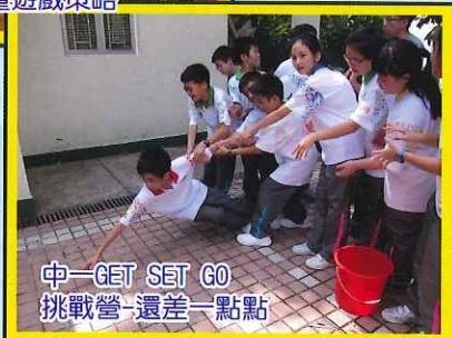
中一GET SET GO 挑戰營-還差一點點