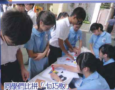
同學們比拼「七巧板」