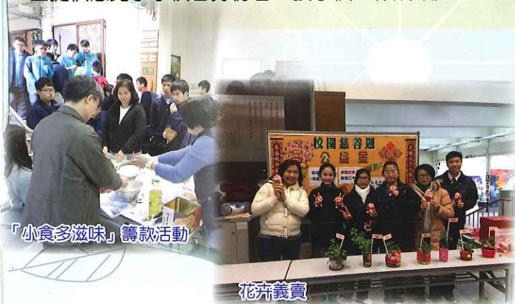
「小食多滋味」籌款活動