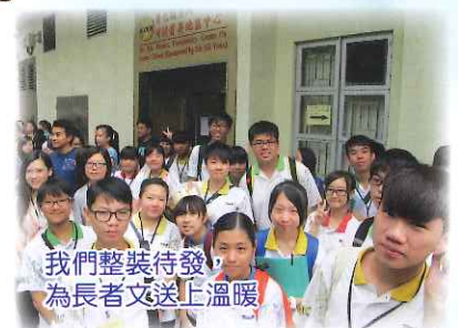
我們整裝待發，為長者文送上溫暖