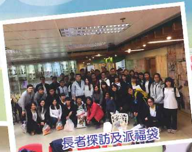
長者探訪及派福袋