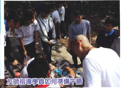
友師指導學員如何準備年膳