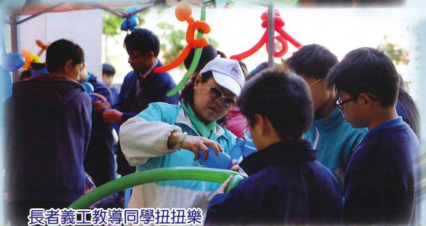
長者義工教導同學扭扭樂