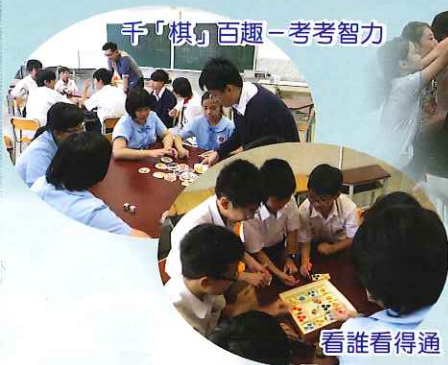
千「棋」百趣-考考智力