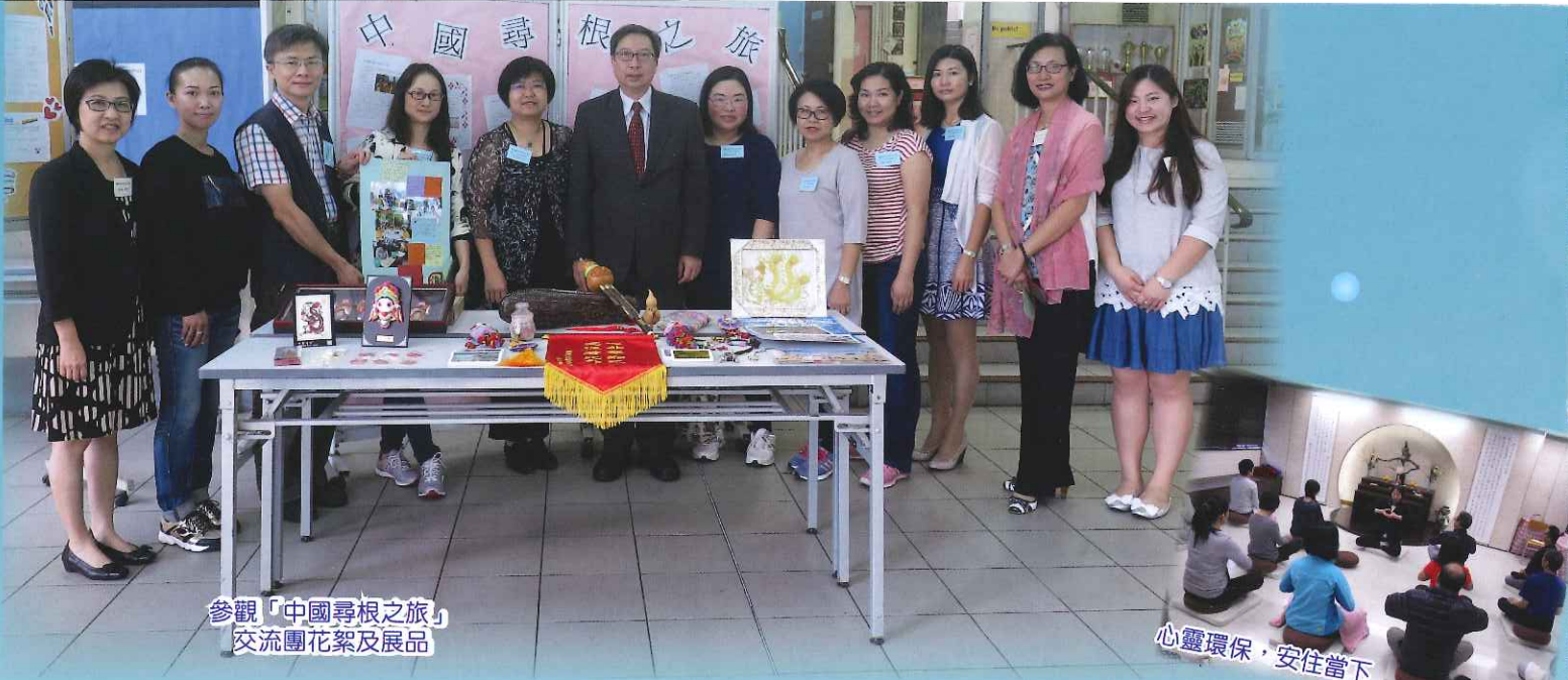
參觀「中國尋根之旅」 交流團花絮及展品