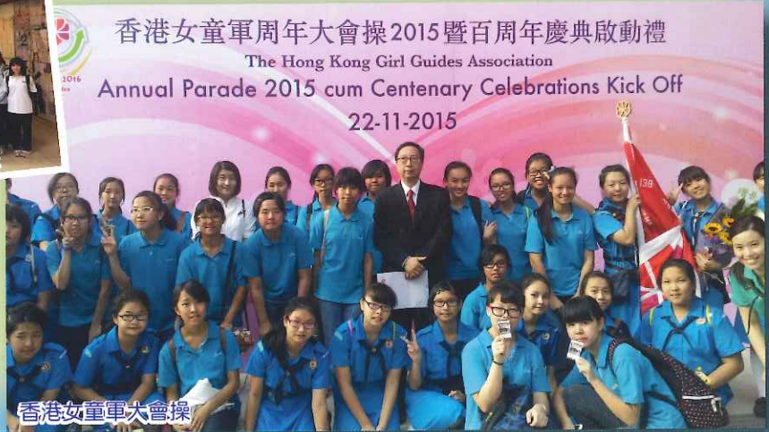
香港女童軍大會操