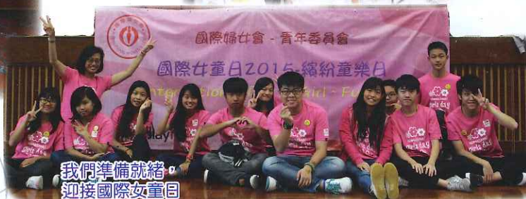
我們準備就緒，迎接國際女童日