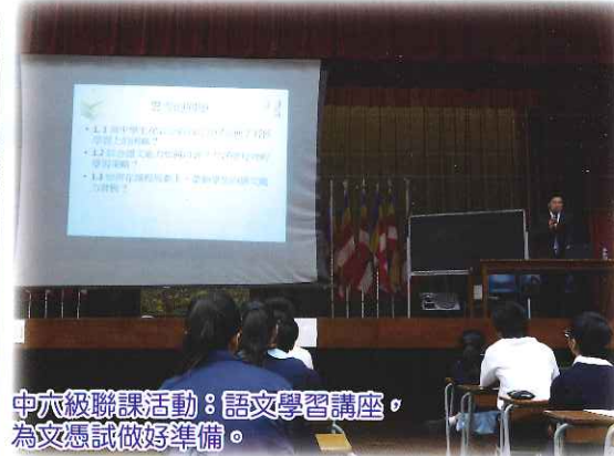
中六級聯課活動：語文學習講座，為文憑試做好準備。