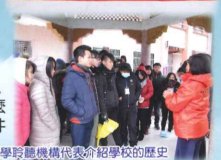
同學聆聽機構代表介紹學校的歷史