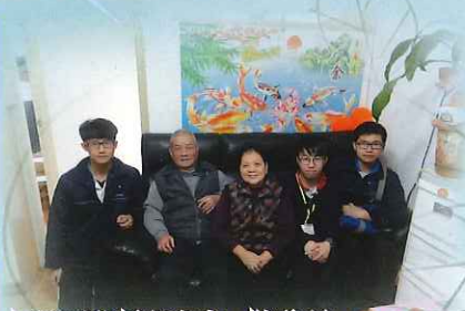
同學到訪長者家中，除聊話家常外，也提早向長者拜早年

是項活動已舉辦了四年。今年特別於農曆新年前舉行，目的是向長者拜年問好。共有45位同學參加，他們分別就讀中二至中六級，在老師及社工指導下，初中同學由高中同學帶領探訪佛教正行長者鄰舍中心的獨居長者。同學分組上門探訪，與長者閒話家常，並送贈福袋，聊表心意，同學的關切問候，讓獨居長者感受到絲絲暖意。