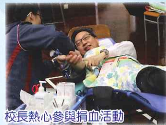
校長熱心參與捐血活動

第一次身體力行，親身參與愛心捐血活動。說真的，自己感到非常緊張，可能是從未試過捐血吧！從近日的傳媒報導中，知道香港紅十字會血庫的存量偏低，所以毅然鼓起勇氣，第一時間就報名參加這別具意義的活動。能幫助有需要的人，自己感到非常高興，希望往後有更多同學參加一年一度的捐血活動。