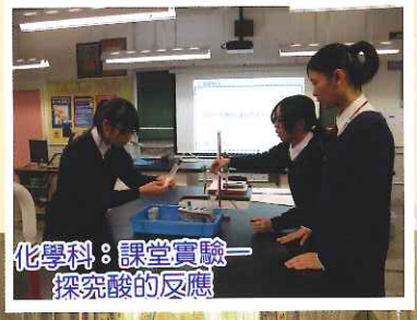
化學科：課堂實驗—探索酸的反應