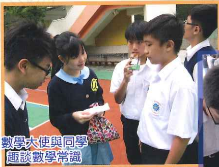
數學大使與同學 趣談數學常識