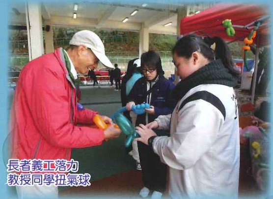
長者義工落力 教授同學扭氣球

是次活動為公益金共籌得善款約$1500，也為家長教師會籌得約$4600，在此衷心感謝全體師生、家長教師會及佛教葉紀南耆康長者學苑的參與！